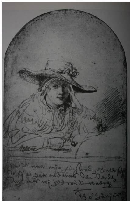
Slika 6. Rembrandt, Saskia van Uylenburch , crtež, 1633.

Ako su nadahnuće, kreativnost ovog crteža bili trenutni, kreativnost Jana van Eycka proteže se kroz vrijeme duge razradbe religioznih tema povezanih s odabranim subjektom. Primjer je njegovo malo Navještenje Gospodinovo , koje se danas čuva u Nacionalnoj galeriji likovne umjetnosti u Washingtonu (sl. 7 i 8). Čini se kao da bi cjelokupna slika mogla biti realistična priča, no, naprotiv, svaki detalj ima simboličko značenje. Anđeo (sl. 7) se smije kao skulpture u katedrali u Reimsu i kao Beatrice u Danteovoj Božanstvenoj komediji . Osmijeh je izričaj božanske ljubavi kao crveni brokatni plašt s obrubima omeđenim perlama i dragim kamenjem. Kruna i žezlo karakteriziraju krilatu osobu poput arhandela.