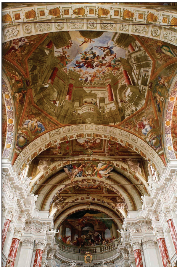
Slika 5. Andrea Pozzo Mondovi, crkva Poslanja.

Napravimo sada na vremenskoj crti skok od kraja 4. stoljeća, kada je bila izgrađena rimska bazilika, u godinu 1676., kada u Mondoviju, u Pijemontu, nailazimo na djelovanje nevjerojatnog umjetnika, isusovca Andree Pozza (sl. 5). On ne samo da stvara viziju koja vodi do apside, nego svojom lažnom