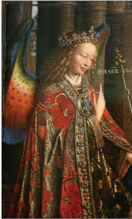
Slika 7. Jan van Eyck, Navještenje Gospodinovo , 1435. (detalj).

središnjeg prozora u prezbiteriju te odgovara prozoru u visini koji pokazuje odraslog Krista, odjevenog u bijelo i crveno, a iznad njega dva crvena serafina. Ništa od tog nije slučajno, nego je sve namjerno odabrano, jer prekid, upad božanskog posred svijeta nije formula koja predočava samo utjelovljenje nego sveto kao takvo.