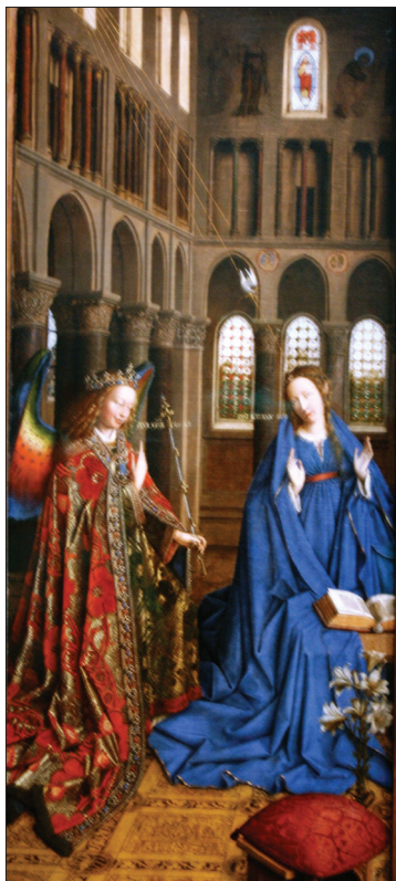
Slika 8. Jan van Eyck, Navještenje Gospodinovo.

prolaze kroz gornji prozor dolaze s neba i povezuju Marijinu glavu, zemaljski element, s vanjskim svijetom, koji je, kako smo vidjeli, već bio shvaćen kao beskrajn u Knjizi dvadestčetvorice filozofa . Ne sjedinjuje se tako samo nebo sa zemljom već i beskonačno s konačnim, univerzalno s pojedinačnim. U Navještenju Gospodinovu Jana van Eycka prodor svetog kao tipični element svetog pokazan je svim sredstvima. To su: središnji prozor između druga dva, okomiti pravac prema Marijinom liku, crveni stupić trifore i pet kockastih udubljenja na krovu. Tim dvama elementima kao što su upad i sjedinjenje pridružuje se i treći. To je anđeo, vjesnik koji dolazi s neba. On je odjeven puno bogatije od Marije, u svećeničku odoru, s krunom i žezlom princa. Sveto je usto uvijek naviješteno elementom koji je puno vrjedniji od zemaljskih oblika.