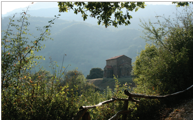
Slika 3. Crkva Svete Kristine Lenske, Asturija.